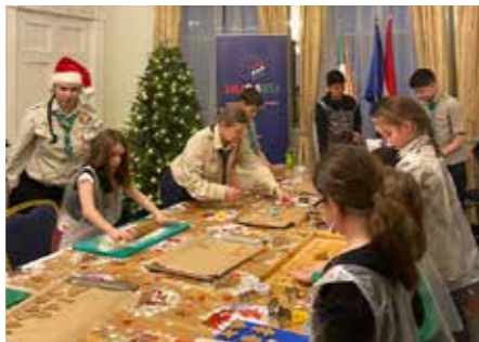
Mézeskalácskészítés a Dublini Magyar Cserkészekkel

A decemberi délután mézeskalácskészítés nyújtásával és szaggatásával indult, kicsik és nagyok lelkes közreműködésével. Amíg a sütőben sülték a finomságok, a résztvevők közösen zenéltek, énekeltek gyerekkorunk