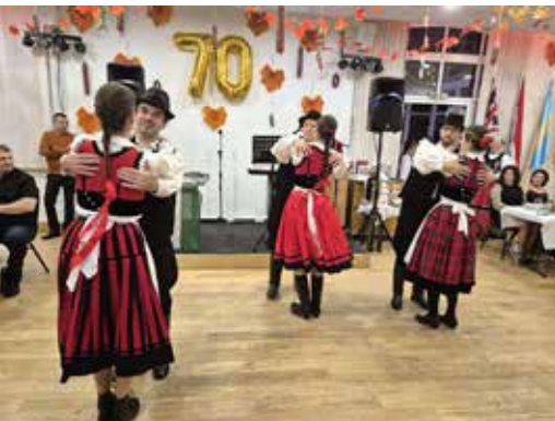
A Hunique Táncgyűttes a londoni disznótoros bálon