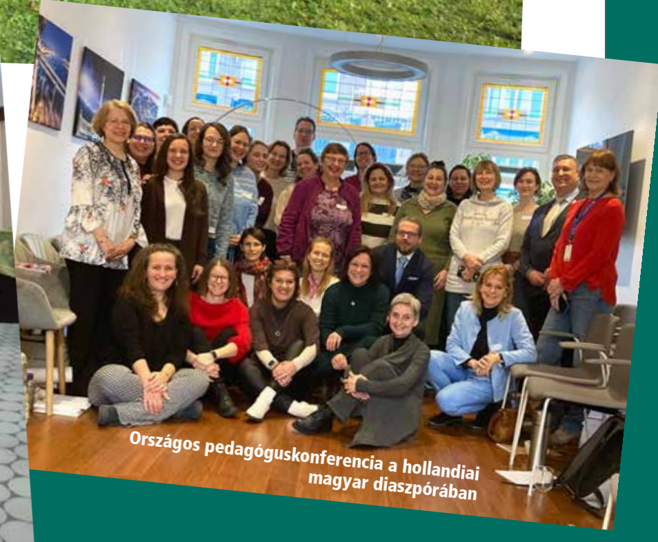
Országos pedagóguskonferencia a hollandiai magyar diaszpórában