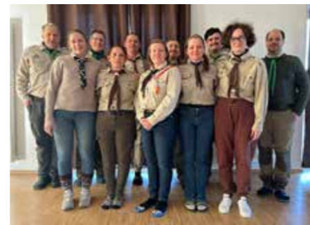
Körzeti vezetői hétvége

Az elmúlt évekhez hasonlóan január harmadik hétvégéjén megrendezték az Észak-nyugati Körzet cserkészvezetőinek hétvégéjét, idén a németországi Kastl-Mennersbergben található Hárshegy cserkészpark területén. Évente egyszer, mindig másik tagországban