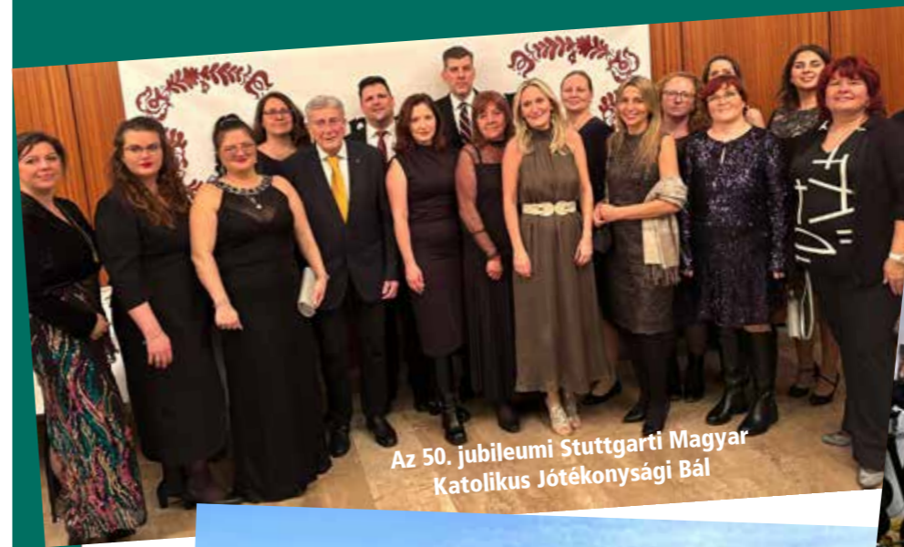
Az 50. jubileumi Stuttgarti Magyar Katolikus Jótékonyági Bál

Hollandiában az idén január 22. és február 1. között rendezték meg az Országos Olvass Hangosan Napokat. Ennek keretében január 26-án az eindhoveni könyvtárban a magyar gyerekek is az anyanyelvükön hallgathatták meg Rinus, a kis orrszarvú kalandjait. ■