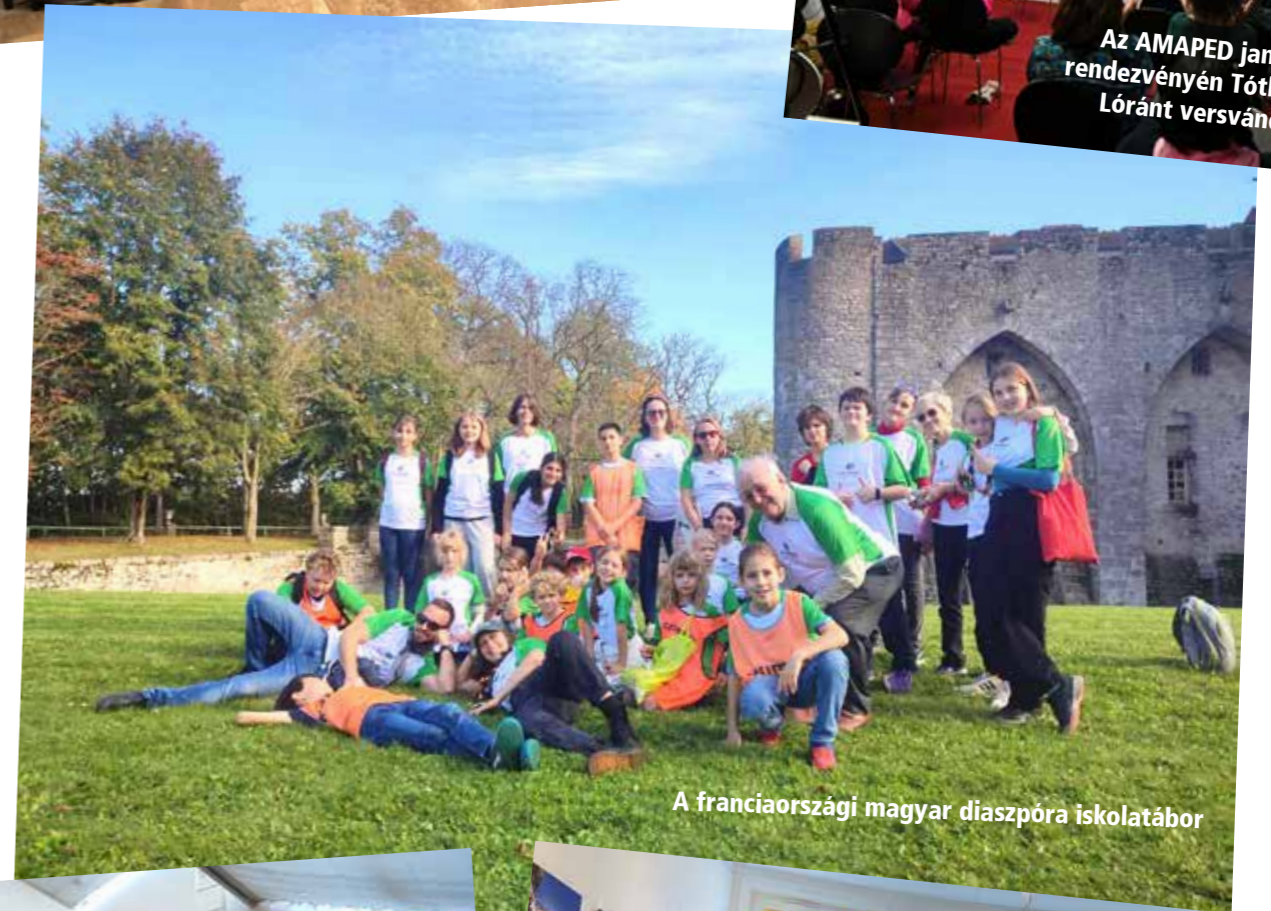
A franciaországi magyar diaszpóra iskolatábor