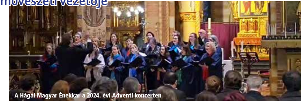
A Hágai Magyar Énekkar a 2024. évi Adventi koncerten

Régóta foglalkoztatott már az a gondolat, hogy megismerjek más országokat, fel-