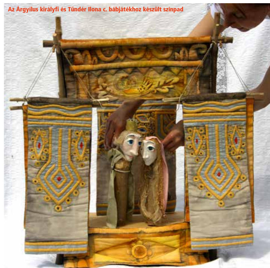
Az Árgyilus királyfi és Tündér Ilona c. bábjátékhoz készült színpad